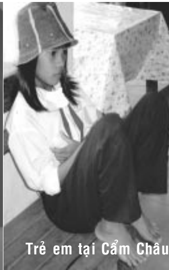
Trẻ em tại Cẩm Châu