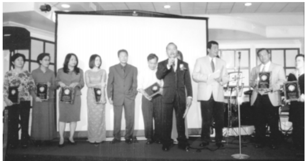
Trao tặng bằng lưu niệm cho các nhà bảo trợ Presenting Appreciation Plaques to Sponsors

Đây là lần đầu tiên sau 10 năm âm thầm hoạt động, hội SAP-VN tổ chức dạ tiệc nhằm gây quỹ giúp trẻ khuyết tật. Do sự ủng hộ quá nhiệt tình của quý vị mạnh thường quân và thân hữu, buổi dạ tiệc đã vượt quá mức dự kiến của hội SAP-VN. Tổng số tiền quyên góp được sau khi trừ chi phí là $48,465. Như vậy sẽ có khoảng 250 em khuyết tật tại Việt Nam được giải phẫu chỉnh hình. Buổi dạ tiệc đã chấm dứt vào lúc 11 giờ đêm với lời cảm ơn của Hội SAP-VN gửi đến tất cả ân nhân, quan khách, quý vị bảo trợ, cơ quan truyền thông và báo chí cùng các ca sĩ, ban nhạc và thiện nguyện viên.