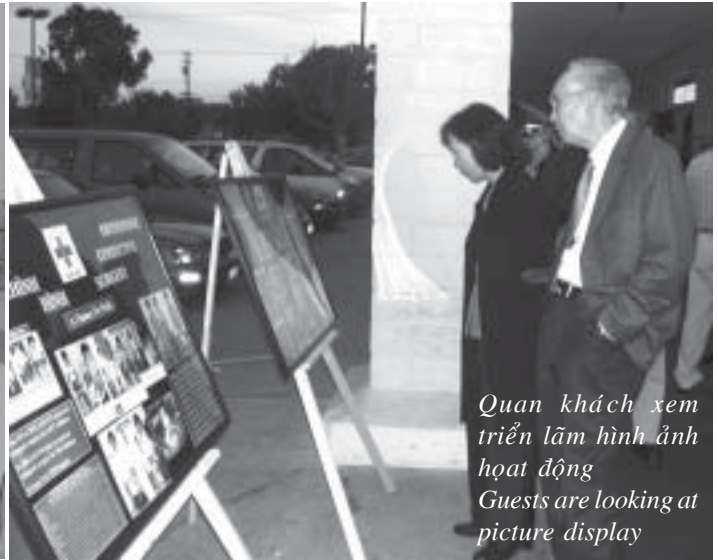
Quan khách xem triển lãm hình ảnh hoạt động Guests are looking at picture display