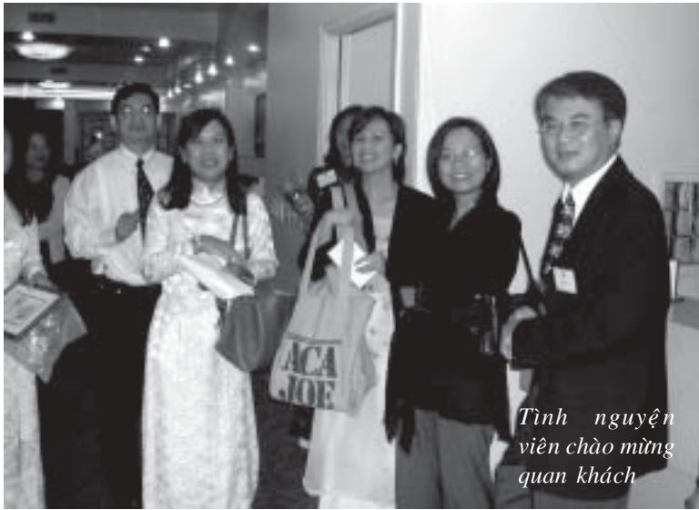
Tình nguyện viên chào mừng quan khách